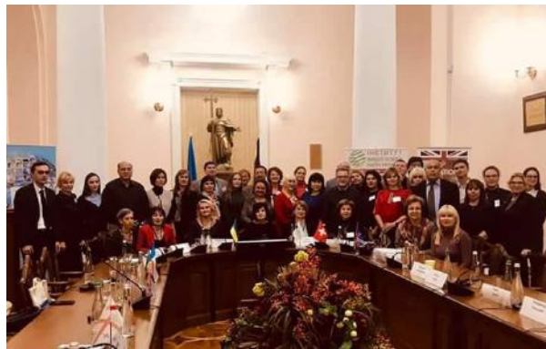
VIII Міжнародна науково практична конференція «Європейська інтеграція вищої освіти України в контексті болонського процесу: студентоцентроване навчання, викладання та оцінювання як частина системи забезпечення якості вищої освіти»

За перший семестр 2019-2020 навчального року було укладено міжінституційні угоди (Interinstitutional Agreement) з ЗВО-партнерами щодо реалізації академічної мобільності студентів, аспірантів і викладачів з університетами, що у перспективі означатиме розширення можливостей для навчання студентів, а також підвищення кваліфікації та викладання наших викладачів у провідних ЗВО Європи ( Necmettin Erbakan University, Туреччина; The State School of Higher Education of Chelm, Польща; UTP University of Science and Technology, Польща, Sumeyman Demirel University, Туреччина, Alanya Alaaddin Keykubat University, Туреччина).